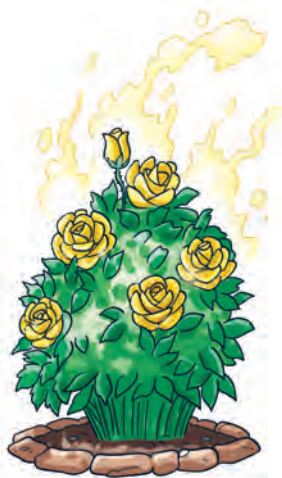
La preziosissima Rosa Gialla Scamorzata